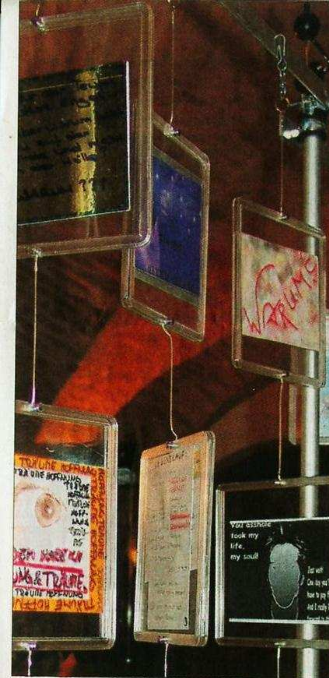
Sie erzählen Schicksale – die Postkarten in der Ehrenhalle des Rathauses.

Sabine Zethmeier vom Verein ist telefonisch für Schulen unter der Telefonnummer 0152/08314961 erreichbar. Der Verein „Gegen Missbrauch“ hat folgende Postanschrift: Am Menzelberg 10, 37077 Göttingen, Telefon 0551/50065699. Für Kinder und Jugendliche steht auch die kostenfreie „Nummer gegen Kummer“ (0800/1110333) zur Verfügung.